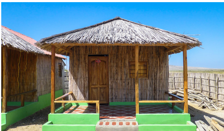
Traditionelle Unterkunft in La Guajira

Unterkunft in Betten in einfachen Wayúu Hütten.