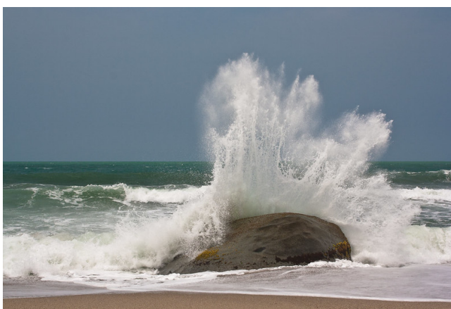
Die energiegeladene Küste von Tayrona.