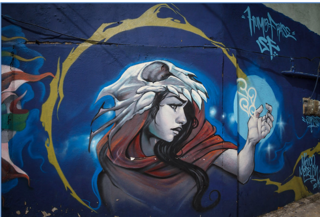
Die farbenfreudige Nachbarschaft Comuna 13

Zweite Übernachtung im Hotel Diez Categoría.