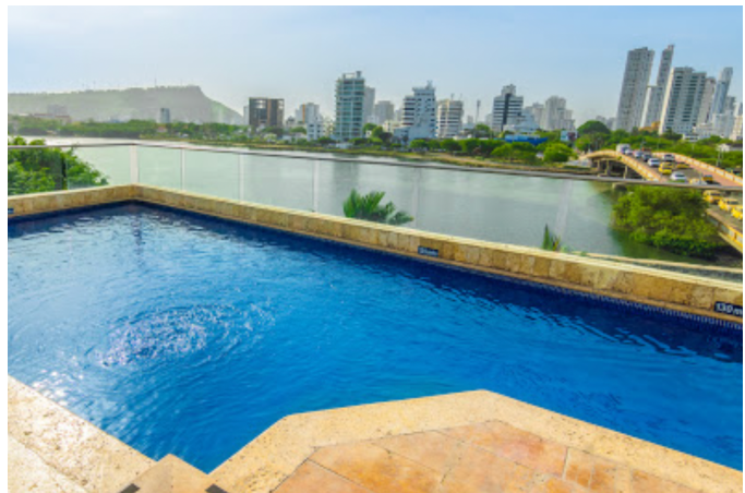
Die Terrasse und der Pool am Dach des Hotel Armería Real

Den restlichen Nachmittag genießen Sie, um sich im Hotel zu entspannen, oder Getsemaní zu erforschen.