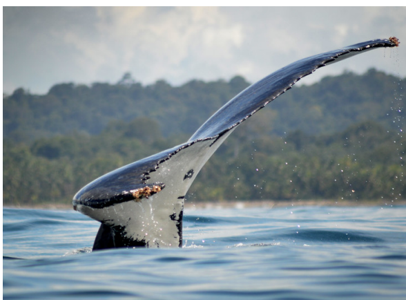
Walbeobachtung in Bahía Solano