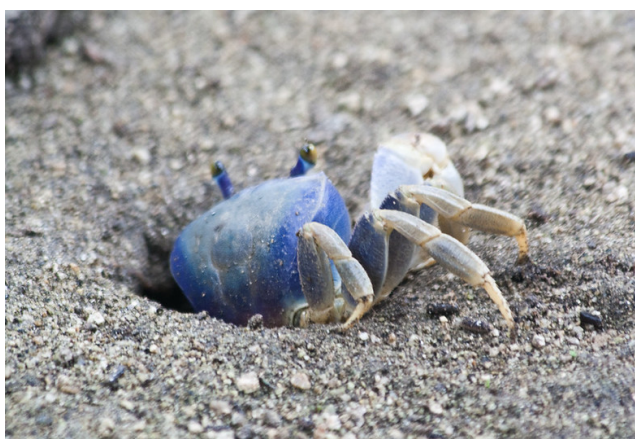
Blaue Krabbe auf dem Ökowanderweg.