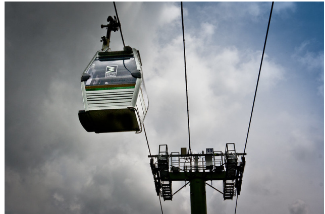
Das innovative MetroCable-System von Medellín