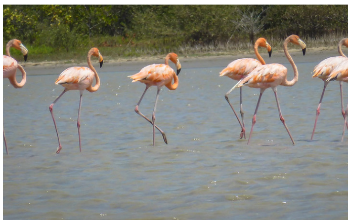
Flamingos in La Guajira