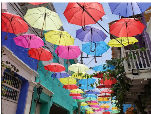
Die farbrächtigen Straßen von Getsemaní.

Das Hotel liegt nur 5 Minuten von Plaza de la Trinidad und 7 Minuten von den Gaststätten der Calle Media Luna entfernt.