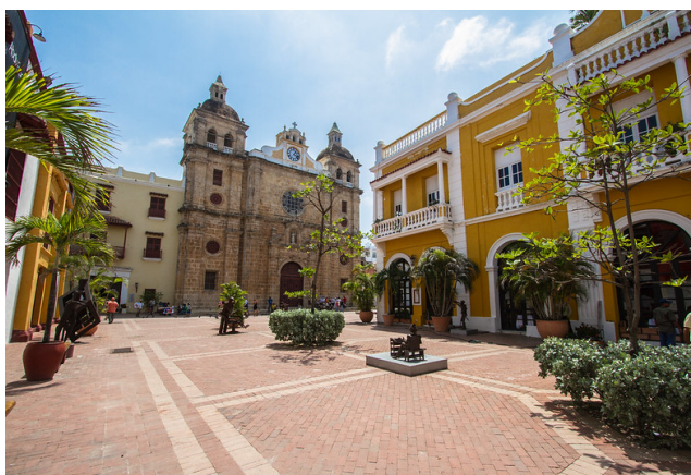
San Pedro Claver.