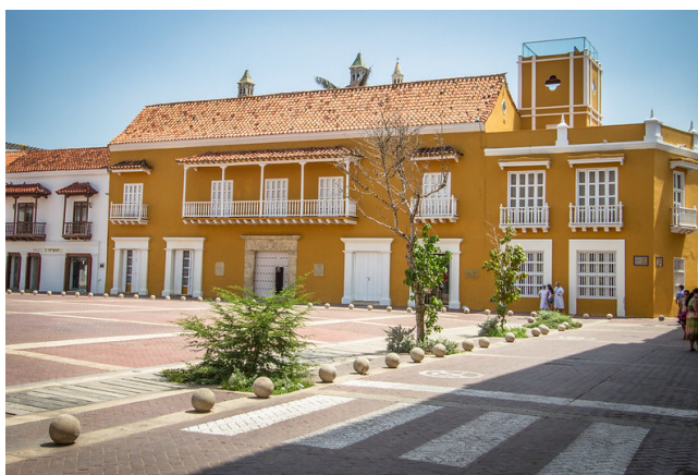
Plaza de la Aduana.

Zweite Übernachtung im Hotel Armería Real.