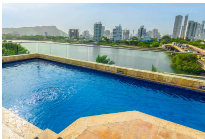
Die Terrasse und der Pool am Dach des Hotel Armería Real.

Den restlichen Nachmittag genießen Sie, um sich im Hotel zu entspannen, oder Getsemaní zu erforschen.