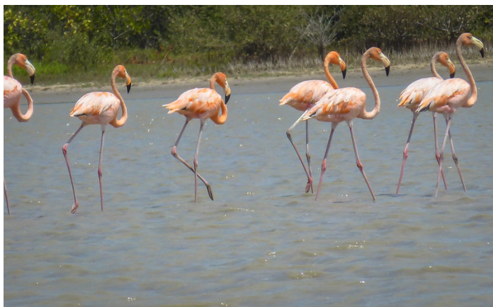
Flamingos in La Guajira.

Der Tourismus ist in La Guajira nicht komplett ausgebaut. Das Hotel Waya Guajira wurde gewählt, weil es eine komfortable Unterkunft ist, sicherlich nicht vergleichbar mit den anderen Hotels, die Sie besuchen werden. Das Hotel bietet folgendes an: Swimmingpool, Whirlpool, Hängematten und Liegen für die Entspannung am Ende des Tages.